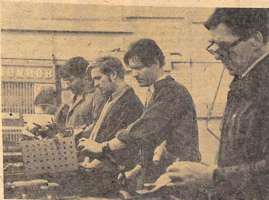
На снимке: в цехе № 42 в день Ленинского коммунистического субботника.

18 ДЕКАБРЯ — ВСЕ НА КОММУНИСТИЧЕСКИЙ СУББОТНИК!